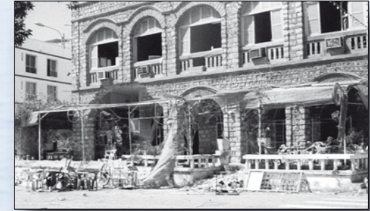
Café l'Historil am Tag nach dem Attentat

Eine Gruppe geht in das einzige begrünte Café, das sich aus dem Staub abhebt. Hier, im Café l'Historil, werden Getränke bestellt, mit fliegenden Händlern verhandelt, gelacht und getratscht. Kurz: das Dasein wird genossen.